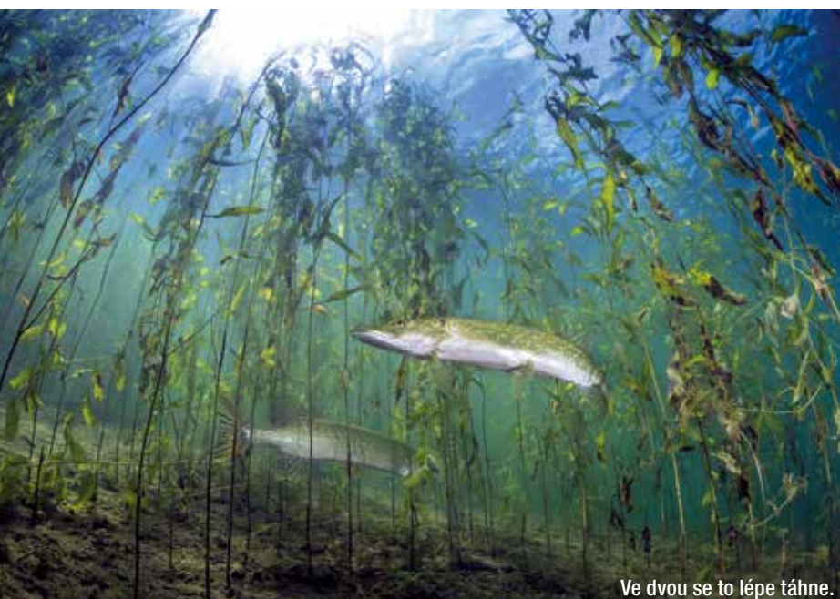
Ve dvou se to lépe táhne.