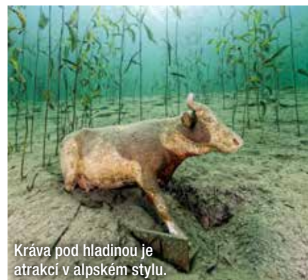
Kráva pod hladinou je atrakcí v alpském stylu.

Další zanoření, tentokrát jihovýchodním vstupem přes molo, dovede potápeče k jižní prohlubni s prameny, dále se ponoří k tzv. „Schwabbelland“ s hloubkou asi 15 m a vystoupá do mělčí zóny k „Barschwiese“, tedy louce okounů, kde potápeče běžně provázejí početná hejna ryb.