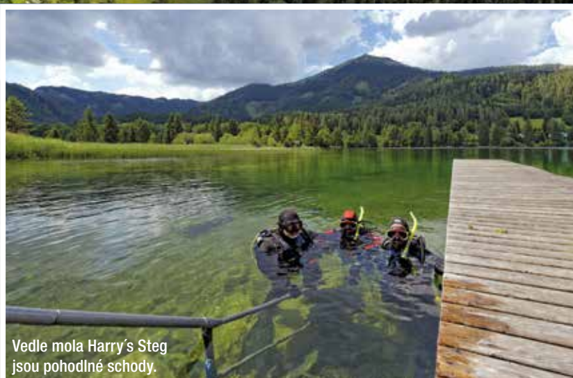
Vedle mola Harry's Steg jsou pohodlné schody.

Asi nikoho nepřekvapí, že voda v jezeře vykazuje kvalitu pitné vody a viditelnost dosahuje až 15 metrů, samozřejmě vyjma období tání sněhu nebo po extrémních srážkách a delším období špatného počasí. Pro první ponor v Erlaufsee doporučujeme jihozápadní vstup „Harry’s Tauchsteg“. Zanořte se nejprve směrem k trojici výcvikových plošin, rozmístěných v hloubkách 5, 7 a 10 metrů a na povrchu označených bójemi. Po krátké aklimatizaci pak naberte kurs podél pravé strany pobřežní linie a mějte oči stále otevřené. V těchto místech je téměř stoprocentně jisté, že spatříte alespoň jednu z kapitálních štik, které tu s oblibou loví. K rados-